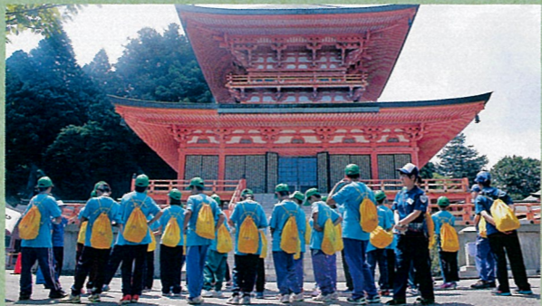
東塔から横川まで、延暦寺の諸堂を参拝する