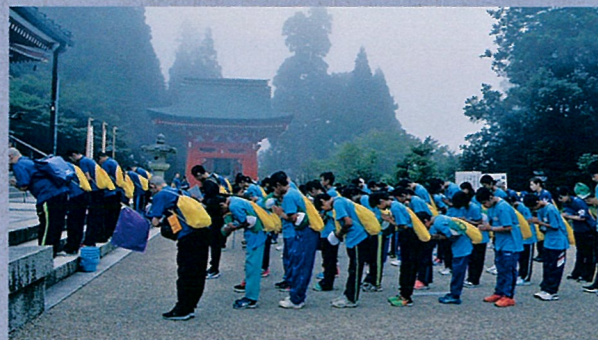
相手を敬う気持ちを合掌から学ぶ

研修期間中は実体験を通じて研修のテーマである「規律と合掌—平和の祈り—」を学びます。平和の祈りでは研修生が世界に向けて平和の合い言葉を発信します。