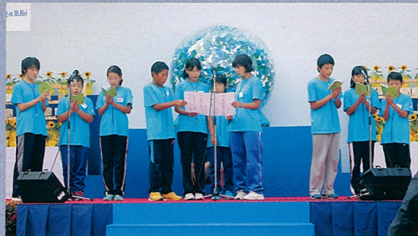
世界に向けて平和の合い言葉を発信する