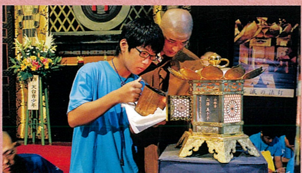
「不滅の法灯」への献油体験から1200年の歴史のおもさを学ぶ

1200年の歴史をもつ「不滅の法灯」への献油体験や、根本中堂での座禅止観体験など、「比叡山の集い」でしかできないことを体験します。