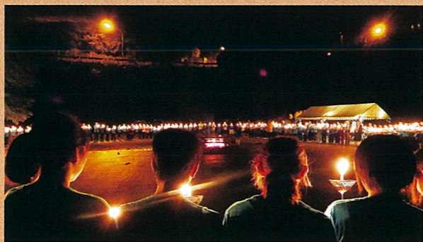
「不滅の法灯」から採火した火を心に刻む