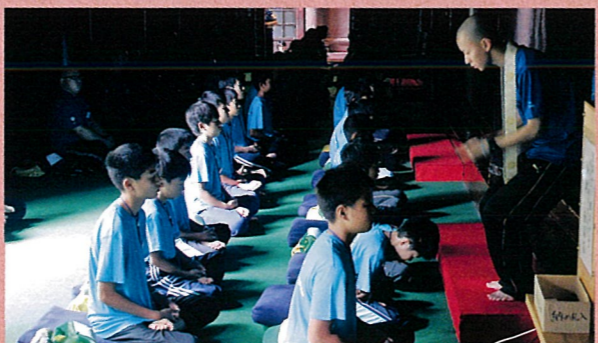
自分を見つめなおす機会になる座禅止観