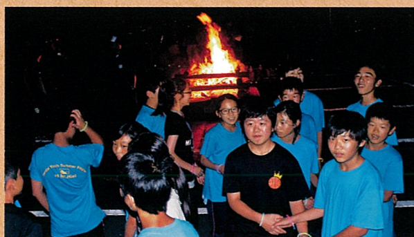
営火を囲んで班ごとに様々なスタンプを披露する

キャンプファイヤーを行い、各班で準備した出し物やゲームを通して、全国の研修生と友情を深めます。期間中一番の盛り上がりを見せます。