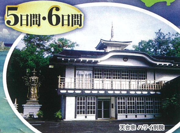
天台宗 ハワイ別院